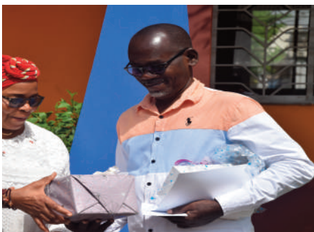
Le Meilleur agent recevant son Prix

L'aspiration à l'excellence est cruciale pour le développement d'une nation. L'Ecole Ivoirienne de Bijouterie et des Métiers Annexes (EIBMA) fait de cette quête une priorité, notamment avec la « Journée de l'Excellence » instaurée depuis 2015. Le 15 décembre 2023, lors de la 3ème édition, l'innovation principale était l'affectation de parrains à chaque classe, offrant ainsi aux apprenants des modèles de réussite et des mentors.