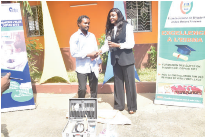
Remise de kit d'installation au meilleur CAP Bijouterie de l'année scolaire 2022-2023