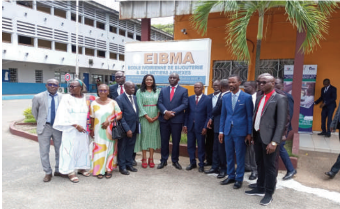
Photo de famille avec Monsieur le ministre