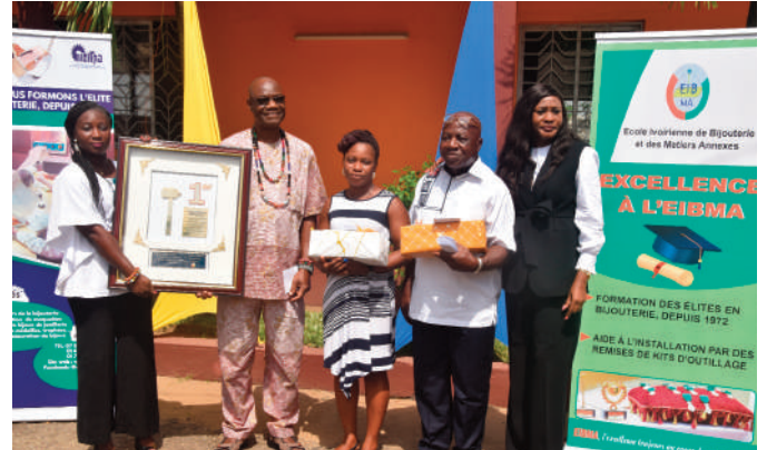
Hommage rendu aux agents retraités