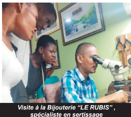
Visite à la Bijouterie "LE RUBIS", spécialiste en sertissage

soudure au laser et le rhodiage. Une immersion au cœur d'une entreprise spécialisée dans la fabrication de trophées et d'objets d'art en résine a également enrichi leur expérience de stage.