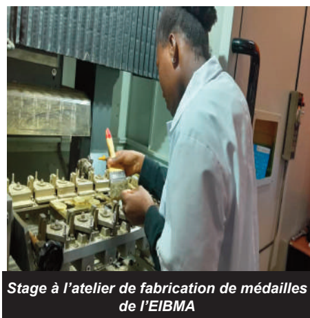
Stage à l'atelier de fabrication de médailles de l'EIBMA

de la bijouterie en participant à des stages pratiques au sein de bijouteries professionnelles. Cette expérience directe leur a permis de mettre en pratique leurs connaissances théoriques acquises au cours de leur formation, développant ainsi des compétences pratiques essentielles pour leur future carrière dans l'industrie.