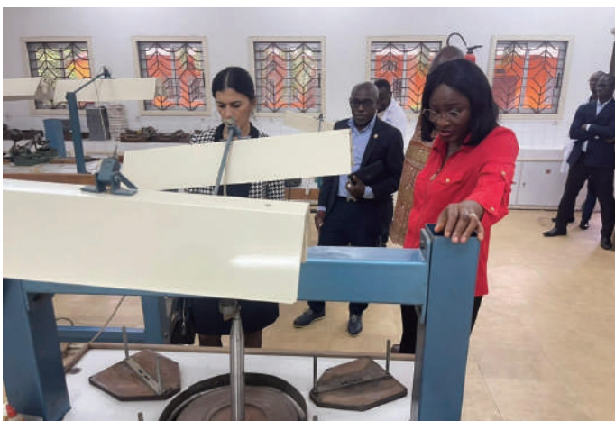
Visite des ateliers