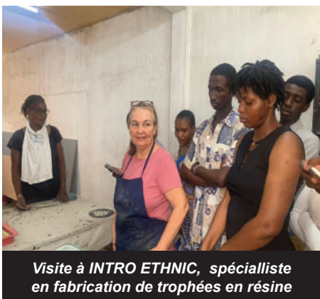
Visite à INTRO ETHNIC, spécialiste en fabrication de trophées en résine

Les stagiaires de l'École Ivoirienne de Bijouterie et des Métiers Annexes (EIBMA) ont démontré leur dévouement lors des stages liés à la Coupe d'Afrique des Nations 2023. Leurs activités variées et enrichissantes illustrent leur engagement continu dans le domaine de la bijouterie.