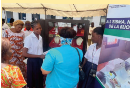
Visite du stand de l'EIBMA

Le vendredi 8 mars 2024, journée dédiée à la célébration des Droits de la Femme, la Direction de la Vie Scolaire (DVS) du METFPA a célébré les femmes et les jeunes filles des métiers industriels au foyer du Lycée Technique de